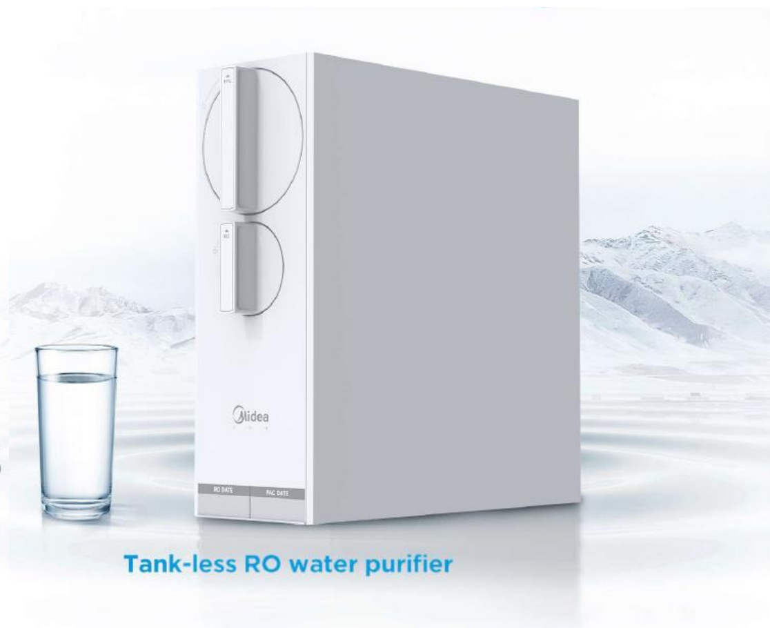
Tank-less RO water purifier